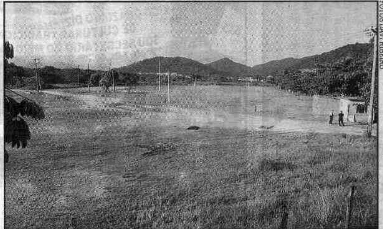
Terreno da Sabesp na Avenida Brasil, Vila Zilda, possui mais de 92 mil m 2 de área

O secretário de Planejamento de Guarujá, Mauro Scazufca, explica que a construção das 682